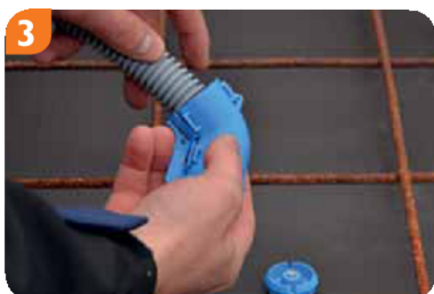
3 Skłapać razem