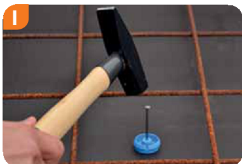
1 Dolną część przybiś do szalunku