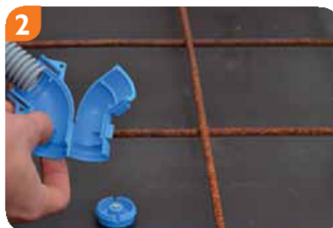
2 Wkliknąć rurę M20 lub M25